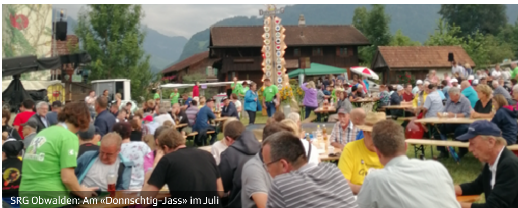
SRG Obwalden: Am «Donnschtig-Jass» im Juli