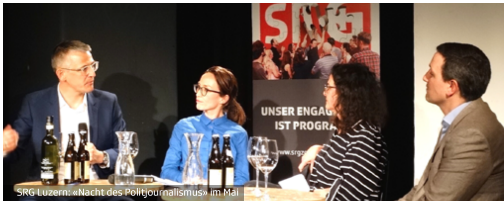
SRG Luzern: «Nacht des Politjournalismus» im Mai