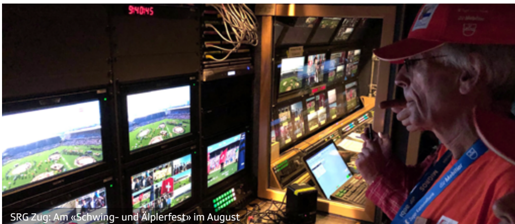
SRG Zug: Am «Schwing- und Älplerfest» im August