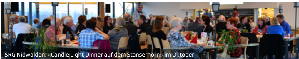
SRG Nidwalden: «Candle Light Dinner auf dem Stanserhorn» im Oktober