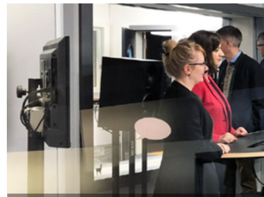
SRG Luzern: «1. Medien-Abend der Luzerner Politik» im D