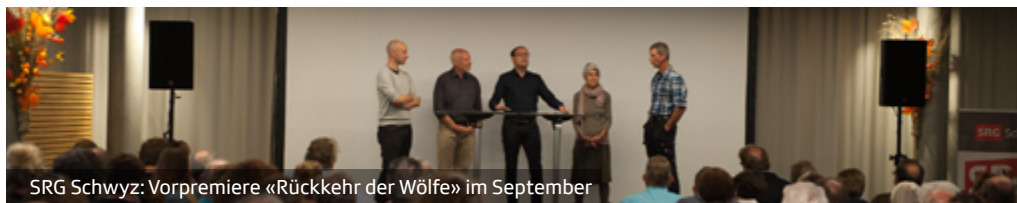
SRG Schwyz: Vorpremiere «Rückkehr der Wölfe» im September