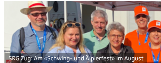
SRG Zug: Am «Schwing- und Älplerfest» im August