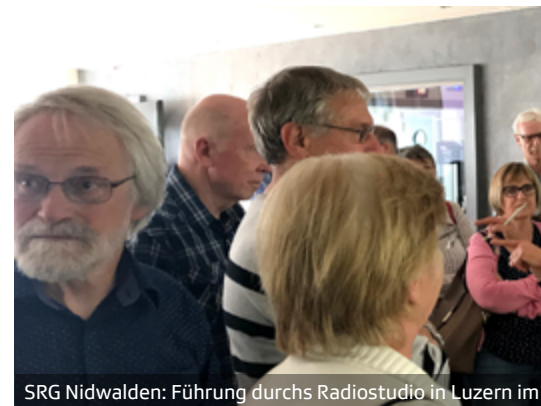
SRG Nidwalden: Führung durchs Radiostudio in Luzern im